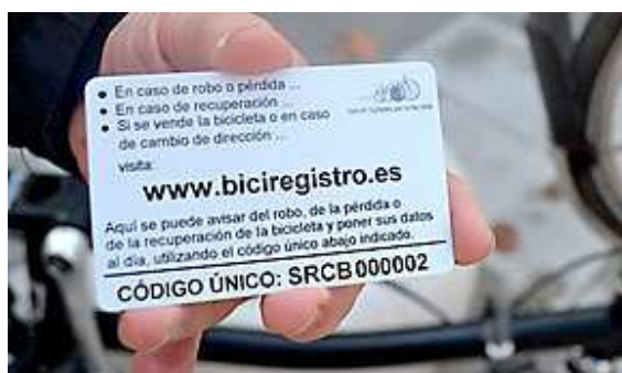
Imagen 16. Tarjeta única y personal de identificación de cada bicicleta.

Es aconsejable guardar la tarjeta del Biciregistro por si es necesario actualizar datos o demostrar que la bicicleta registrada con este número es la tuya. El número de la tarjeta coincide con el número de los adhesivos con los que has identificado tu bicicleta. Cada una de las bicicletas a tu nombre, tendrá su propio código único y tarjeta personal.