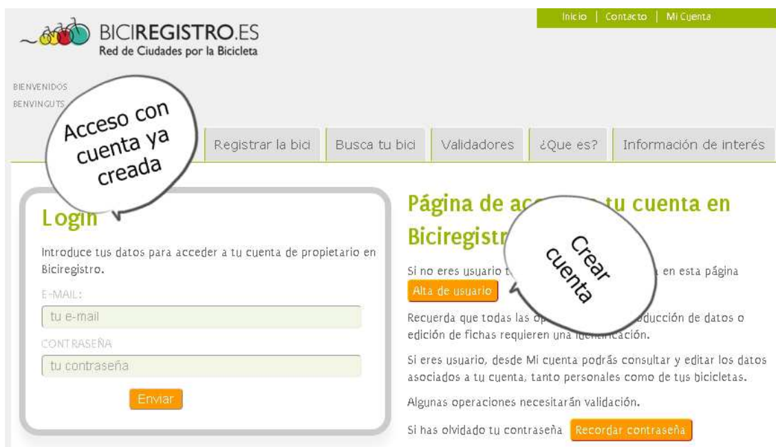
Imagen 2. Pantalla de identificación para crear tu cuenta y acceder a ella una vez creada