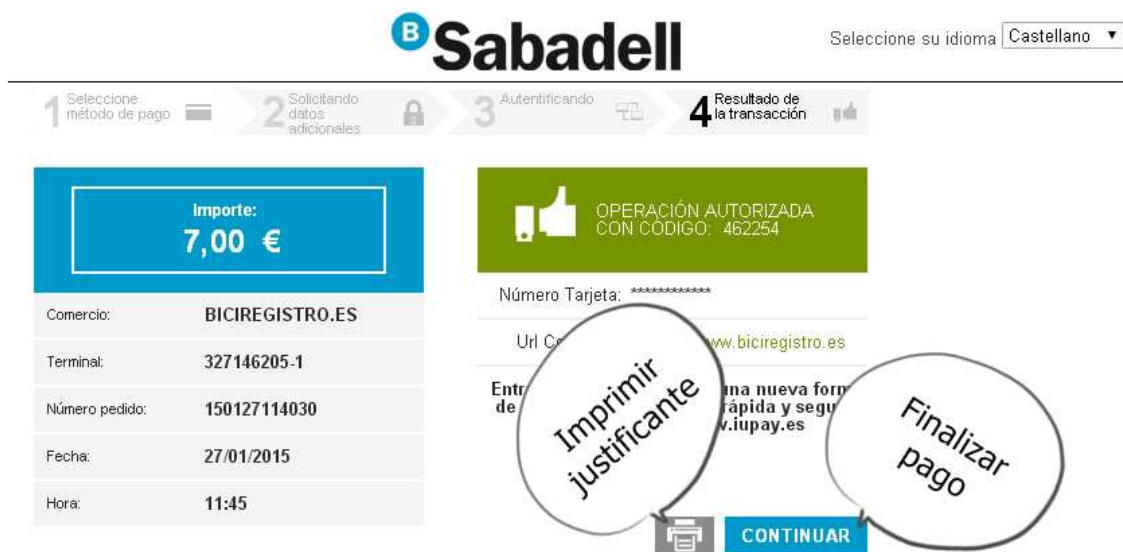
Imagen 6. Plataforma de pago

Desde el icono “pagar” se llegará a una plataforma segura de pago. Una vez realizado éste, es muy importante que imprimas o fotografíes con tu móvil el justificante de pago (para poder presentarlo en la posterior validación) ( Imagen 6 ).