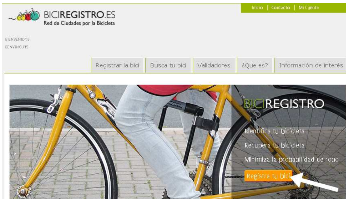
Imagen 1. Ruta para crear y acceder a tu cuenta de registro

En primer lugar, accedemos a la Web Oficial del Bici-Registro ( www.biciregistro.es ) y pinchamos en el icono naranja que lleva el título “Registra tu bici” ( Imagen 1 ). Desde este icono y también desde el que se denomina “Mi cuenta” (parte superior-derecha), podrás ingresar en una pantalla de identificación al sistema. Aquí podrás crear tu cuenta personal (icono “Alta de usuario”) o bien acceder a la misma una vez que la hayas creado (“Login”) ( Imagen 2 ).