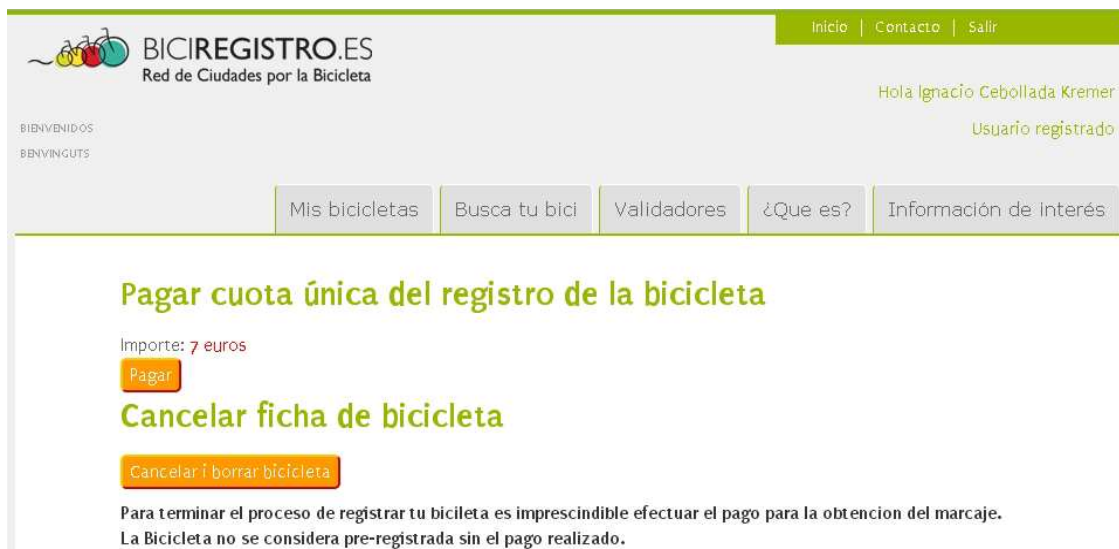
Imagen 5. Pantalla de acceso al pago en línea de la cuota del registro.

Desde el icono “pagar” se llegará a una plataforma segura de pago. Una vez realizado éste, es muy importante que imprimas o fotografíes con tu móvil el justificante de pago (para poder presentarlo en la posterior validación) ( Imagen 6 ).