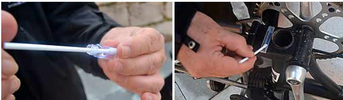
Imagen 14 y 15. Aplicación del líquido UV.