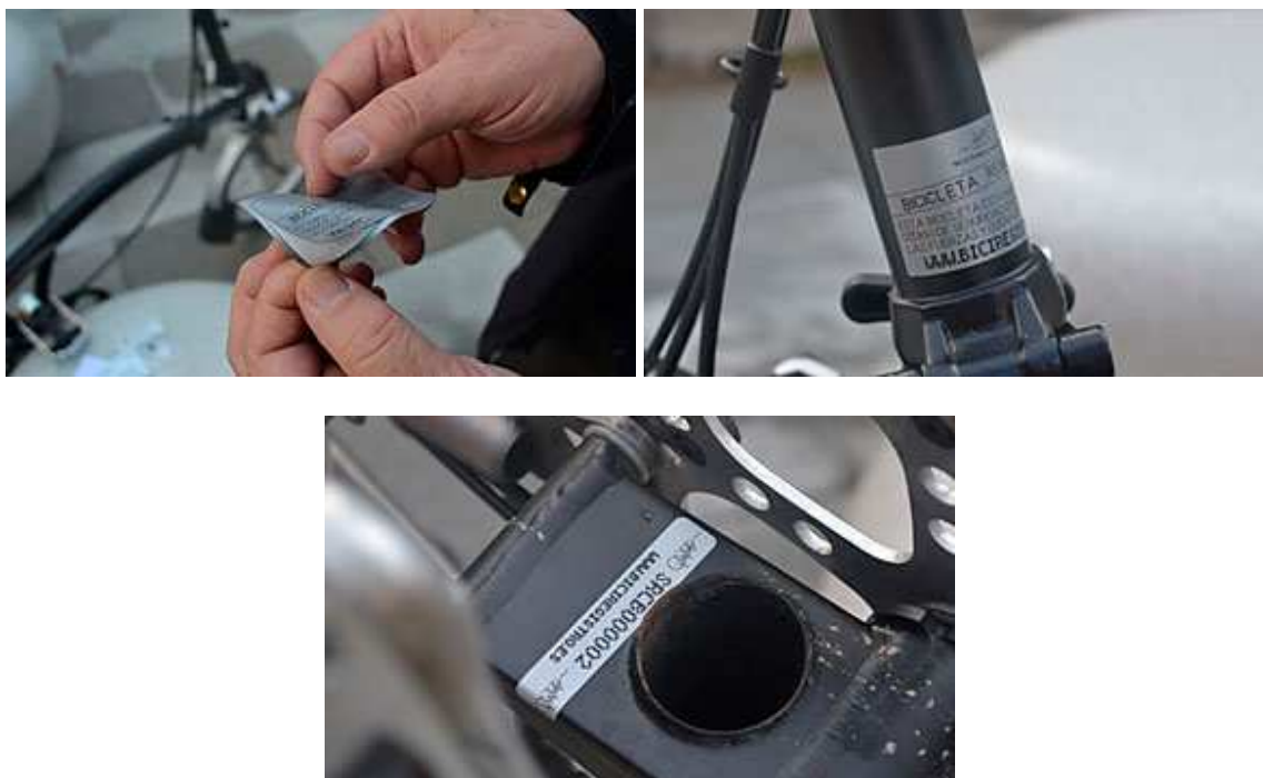
Imagen 11,12 y 13. Colocación de pegatinas adhesivas.

Debes elegir bien el lugar donde colocarás los adhesivos, ya que una vez enganchados no se podrán despegar y volver a enganchar. Antes de colocar el adhesivo, limpia el lugar donde lo pondrás. Debe quedar bien limpio y seco.