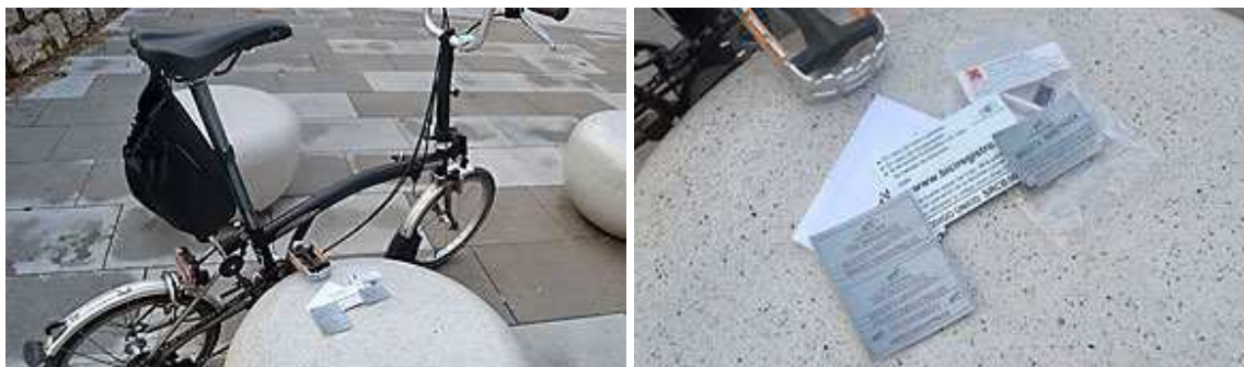
Imagen 10 y 11. Kit de Bici-registro