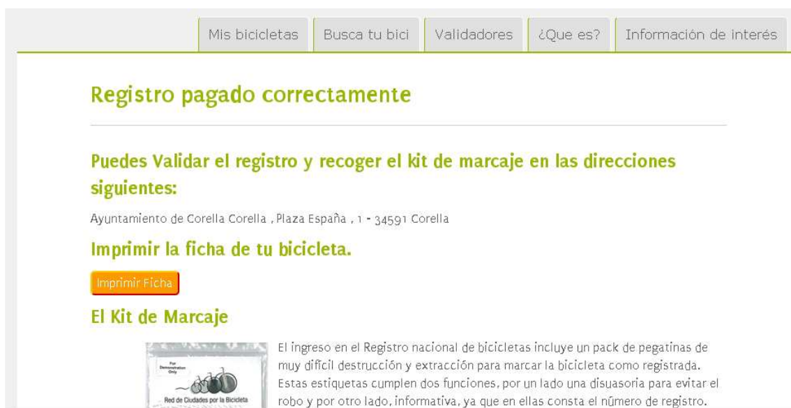
Imagen 7. Pantalla de confirmación del correcto pago del pre-registro.